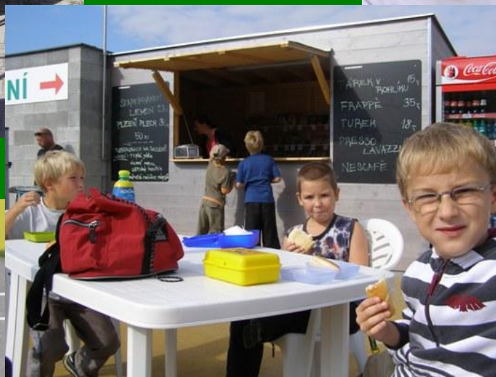
stánek s občerstvením