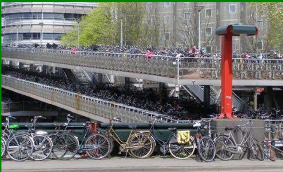
Amsterdam-nádraží : „parking“ pro 8000 kol