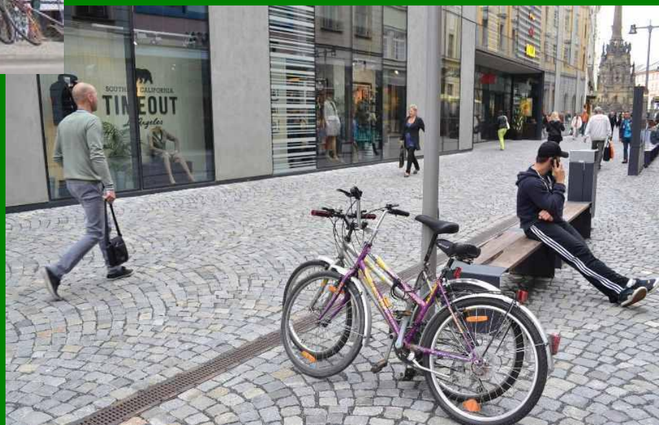
Olomouc – centrum, nová Galerie Moritz