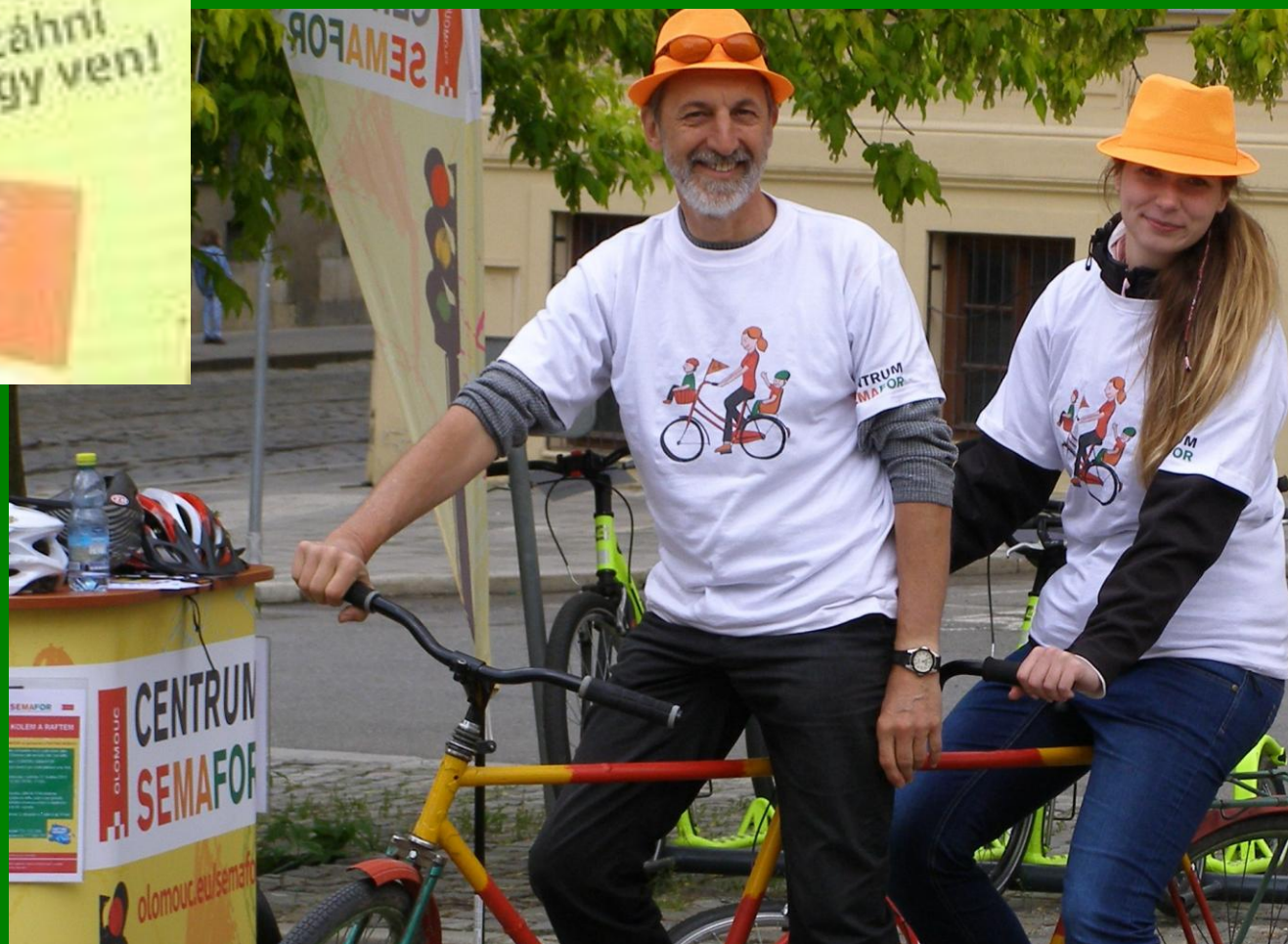
Z akce „Do práce na kole“